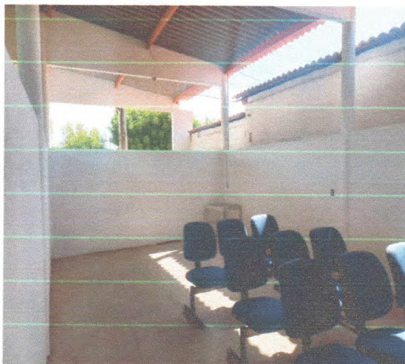
Figura 3 – Caibros apoiados em pilares de concreto