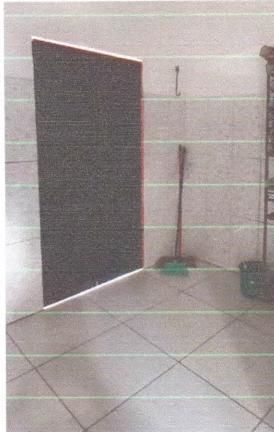
Figura 12 – Porta metálica