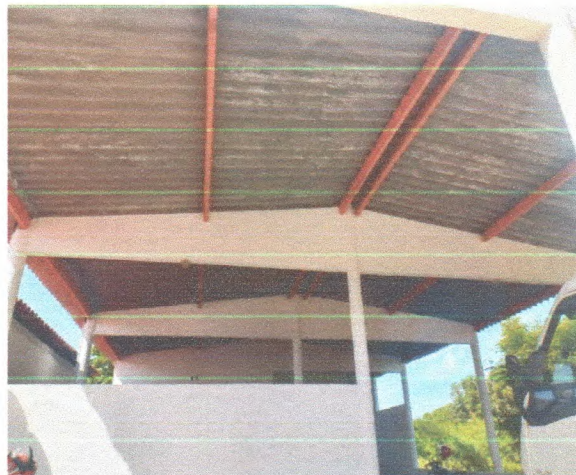
Figura 2 - Estrutura da edificação

Durante a vistoria não foram constatadas patologias aparentes associadas a estrutura do prédio. Porém sugere-se o acompanhamento constante para que não ocorra nenhuma patologia associada à estrutura do telhado, pois as principais patologias de telhados metálicos é corrosão, ela pode se manifestar de diversas maneiras, dependendo do tipo de material, do ambiente, da exposição, de associações inadequadas entre metais diferentes e dentre outros fatores. Outro ponto são os caibros apoiados em vigas e pilares de concreto, favorecem o surgimento de patologias associadas à carga pontual exercida em um ponto, conforme as figuras 2 e 3.