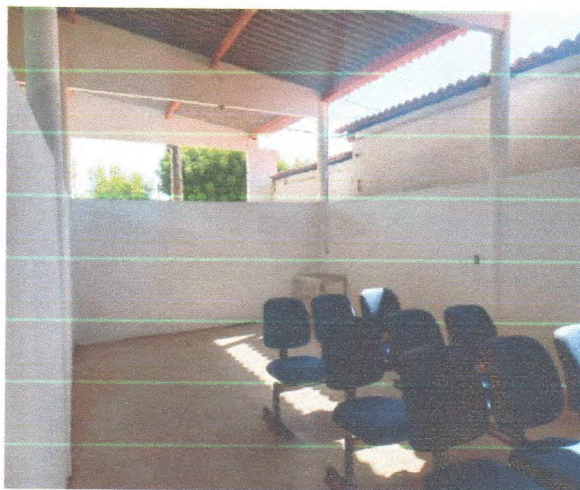
Figura 4 – Pintura recepção

Observa-se que a pintura dentro do prédio se apresenta em boas condições e não há necessidade de nenhum reparo. Além disso, em todos os locais de revestimento apresentam boas condições.