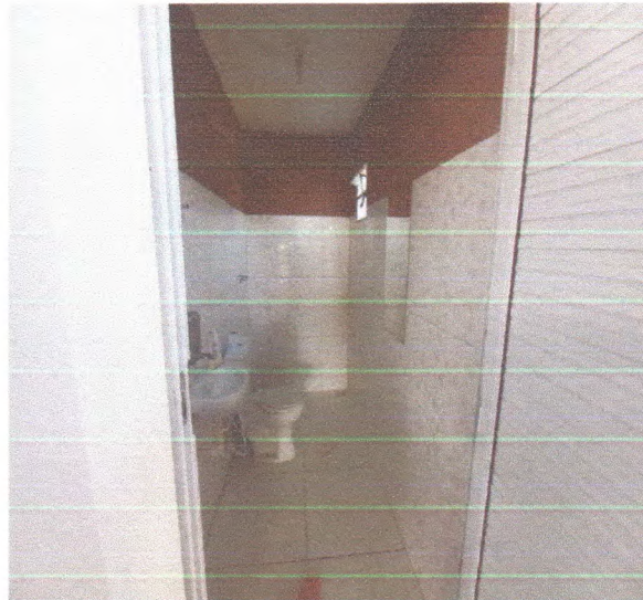
Figura 13 – Instalações hidrossanitárias banheiro