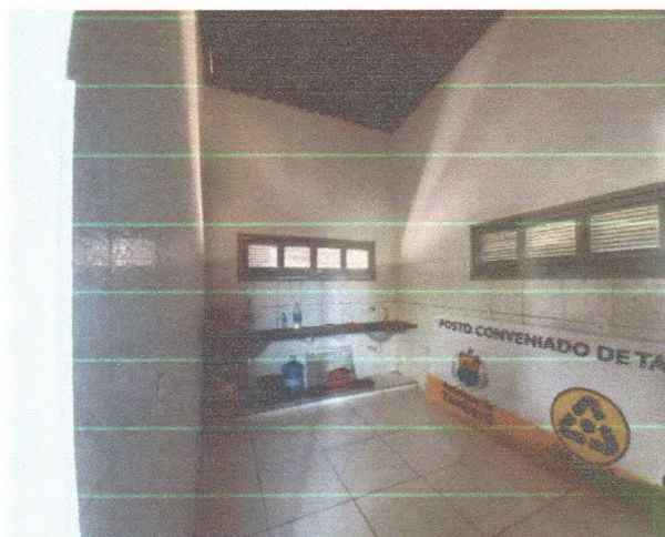
Figura 7 – Revestimento cozinha

DANIEL NASCIMENTO C. DOS ANJOS CREA Nº 05.913743-6 PORTARIA 1067/2022