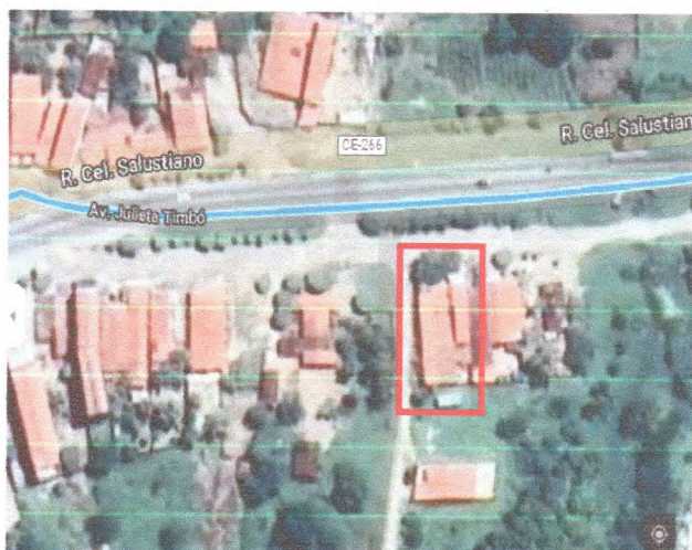
Figura 1 – Vista aérea do empreendimento