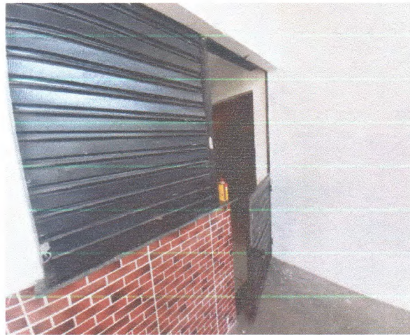
Figura 6 – Revestimento e pintura entrada