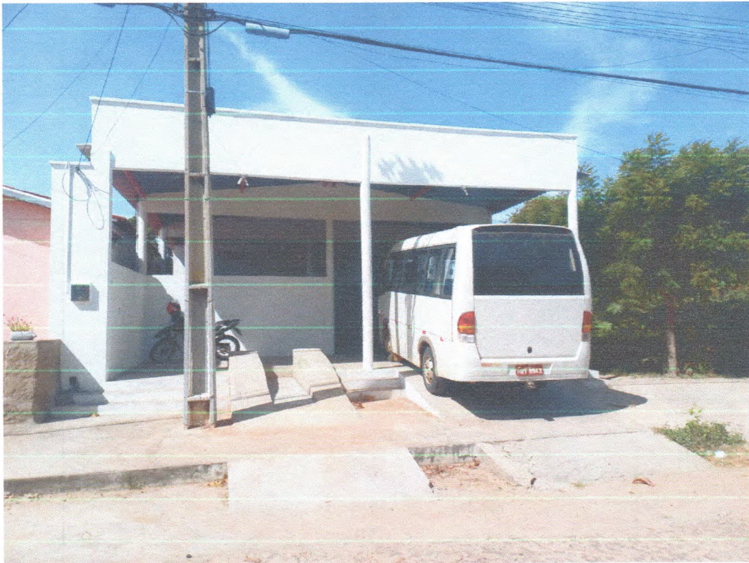
LAUDO TÉCNICO – PRÉDIO PARA ALUGUEL PELA PREFEITURA MUNICIPAL DE TAMBORIL-CE