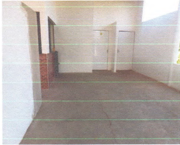
Figura 5 – Pintura entrada