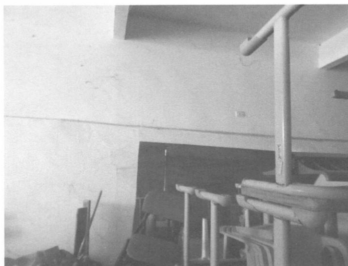
Figura 5 - Revestimento parede