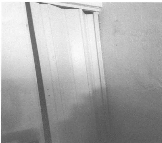
Figura 10 – Porta banheiro