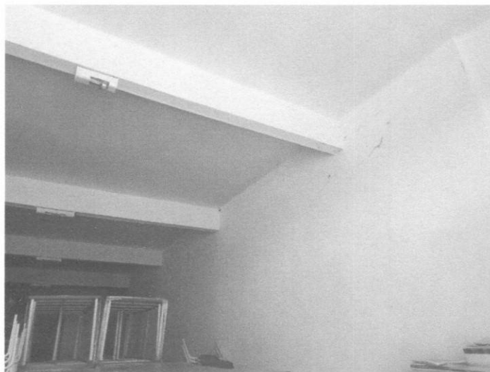
Figura 08 – Ponto de iluminação