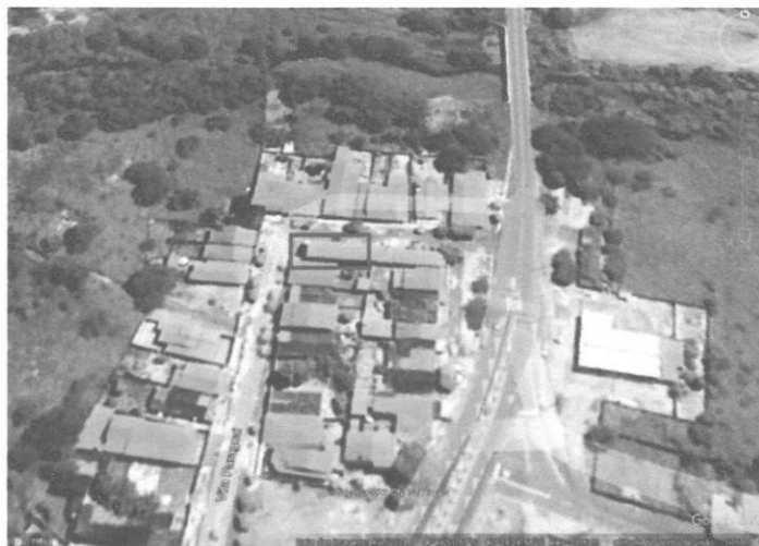
Figura 1 - Localização