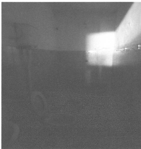
Figura 12 - Instalações hidrossanitárias banheiro