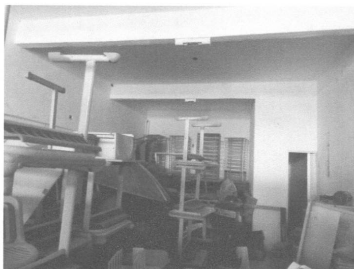
Figura 3 - Estrutura prédio

João Victor Lyda Silva Engenheiro Civil CREA/CE 062096585-1