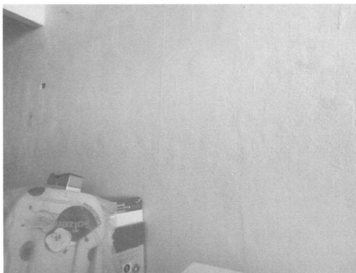
Figura 4 – Revestimento parede

A alvenaria apresenta boas condições, o revestimento das paredes internas está em boas condições, observa-se apenas no cômodo dois, uma umidade aparente devido a falta de escoamento da água que cai do seu telhado. O piso está completo cerâmico no primeiro cômodo e cimentício no segundo cômodo.