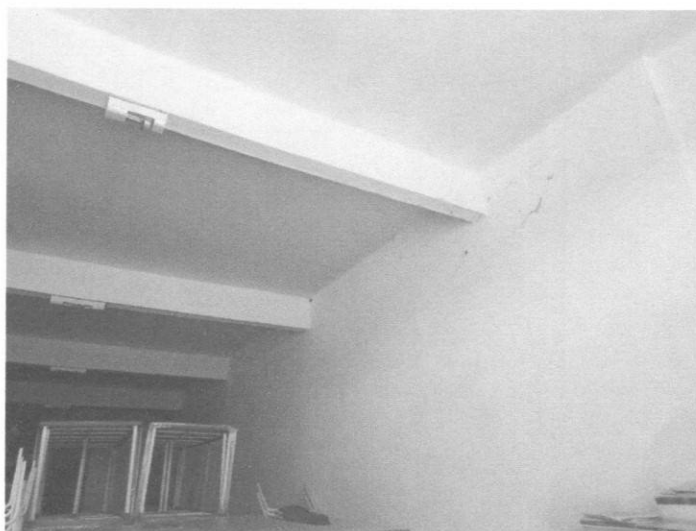
Figura 2 – Estrutura prédio

Durante a vistoria não foram constatadas patologias aparentes.