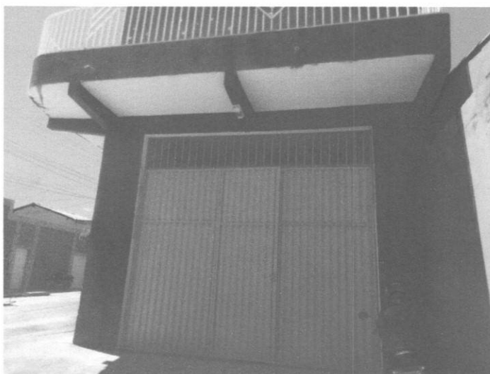
Figura 09 – Portão entrada principal

As esquadrias, em sua maioria, apresentavam estado de conservação funcional, não apresentando nenhuma patologia evidente.