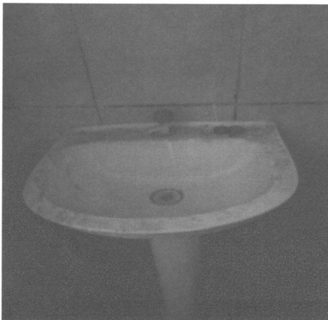
Figura 11 – Instalações hidrossanitárias banheiro

Na vistoria, observou-se que os aparelhos hidrossanitários presentes no banheiro apresentavam conformidade física e de instalação adequados as normas técnicas.