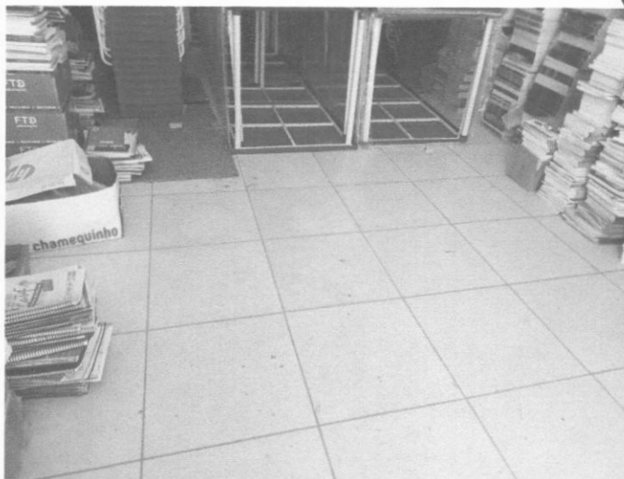
Figura 6 – Piso cerâmico

O piso do prédio é constituído todo em cerâmica.