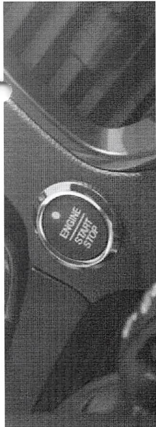
Ford Power - Partida sem chave