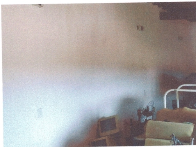
Figura 15 – Luminárias de parede no pavimento superior