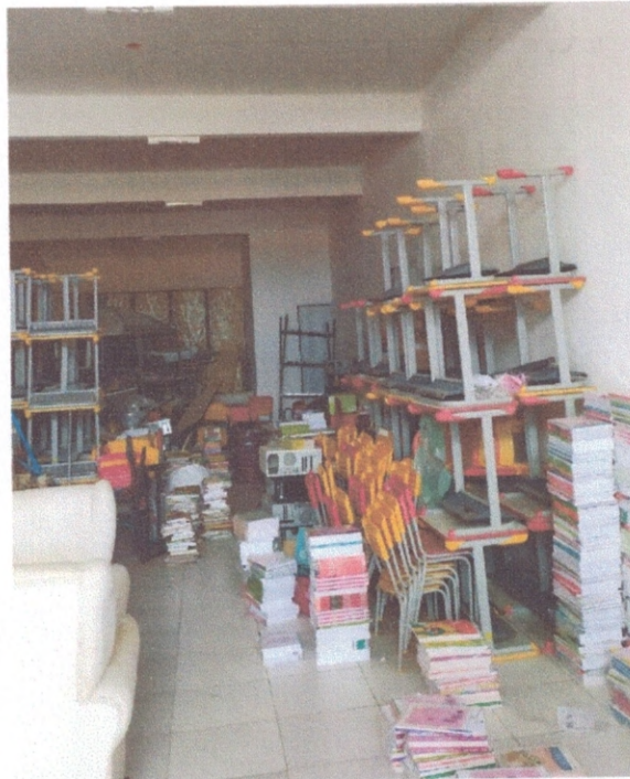
Figura 10 – Piso cerâmico do térreo