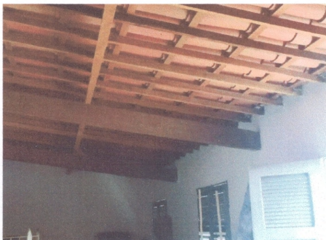
Figura 18 – Telhado observado do pavimento superior

As instalações de manejo de águas pluviais constituída pelo telhado de madeira com telha cerâmica colonial observados pelo pavimento superior apresenta bom estado de conservação com nenhuma patologia ou áreas de vazamento.