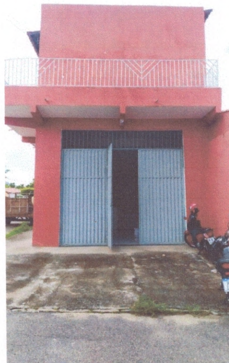
LAUDO TÉCNICO – PRÉDIO DE DEPÓSITO DE MATERIAIS DA PREFEITURA MUNICIPAL DE TAMBORIL