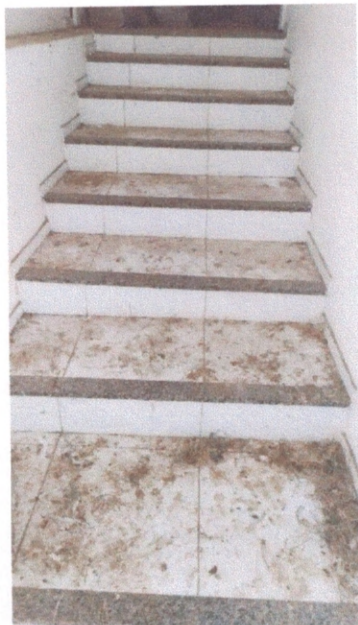
Figura 4 – Escada de acesso ao segundo pavimento

O acesso ao segundo pavimento é feito por escada em L. Observa-se na Figura 5 a área de acesso ao segundo pavimento onde a estrutura de concreto armado neste pavimento serve de apoio ao telhado.