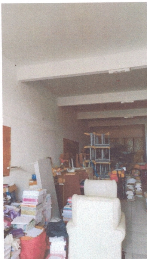
Figura 2 – Estrutura de concreto armado do depósito

Durante a vistoria não foram constatadas patologias aparentes associadas a estrutura do prédio. Sugere-se o acompanhamento da flecha máxima de flexão das vigas devido ao tamanho do vão vencido pela viga.