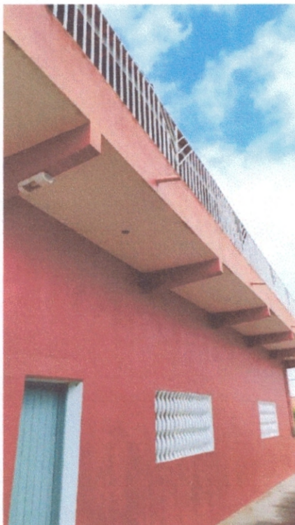
Figura 3 – Marquise do depósito

A marquise do edifício também não apresentou nenhuma patologia aparente.