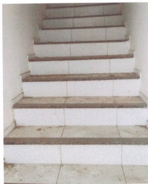
Figura 11 – Piso cerâmico da escada

DANIEL NASCIMENTO C. DOS ANJOS CREA 0619137436 PORTARIA 030/2021