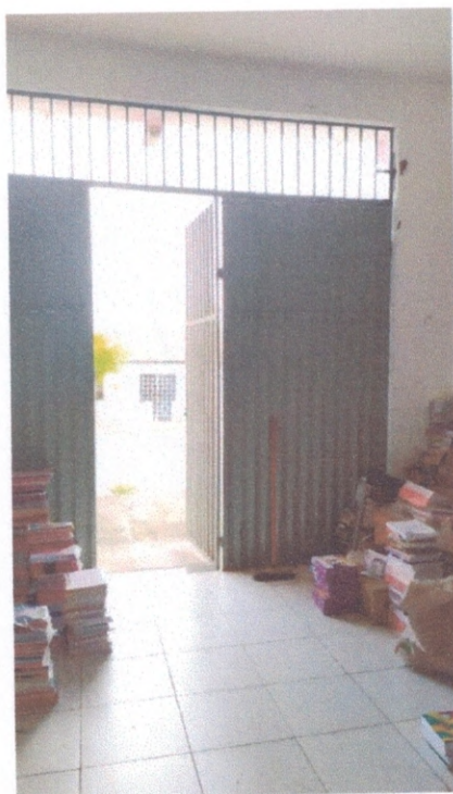
Figura 16 – Portão de entrada do depósito

O portão de acesso ao depósito apresenta a funcionalidade adequada e o espaço adequado para o trânsito de materiais e equipamentos no depósito. Durante a vistoria não foram encontrados nenhuma patologia relacionada ao portão mostrado na Figura 16.