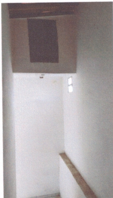
Figura 5 – Estrutura do acesso do segundo pavimento

O acesso ao segundo pavimento é feito por escada em L. Observa-se na Figura 5 a área de acesso ao segundo pavimento onde a estrutura de concreto armado neste pavimento serve de apoio ao telhado.