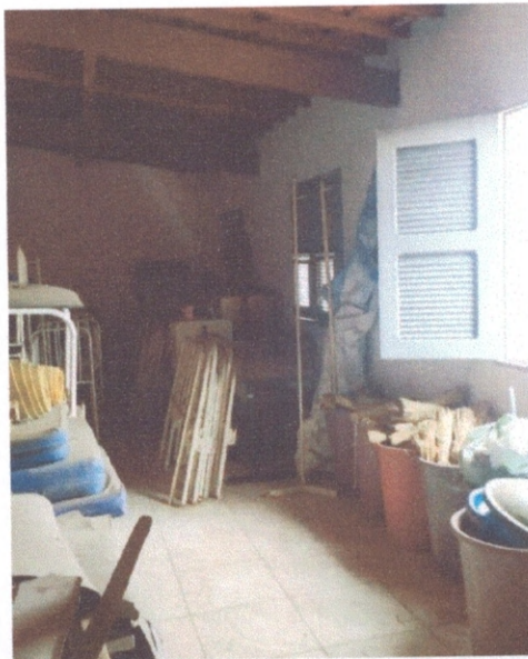
Figura 12 – Piso cerâmico do pavimento superior