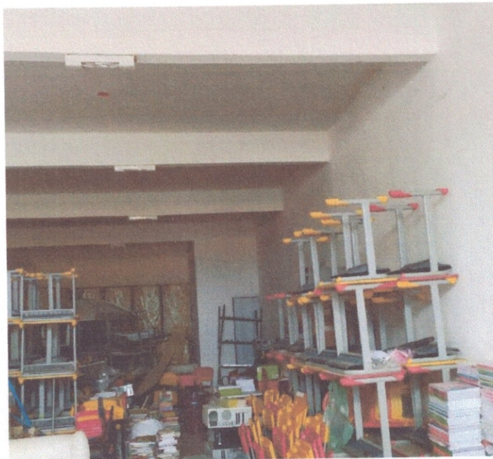
Figura 13 – Luminárias instaladas em vigas de concreto armado