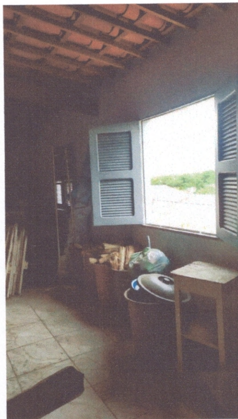
Figura 17 – Esquadrias do pavimento superior

As esquadrias do pavimento superior (Figura 17) apresentavam boa funcionalidade para seus usuários, e também não foi encontrado patologias associadas as mesmas.