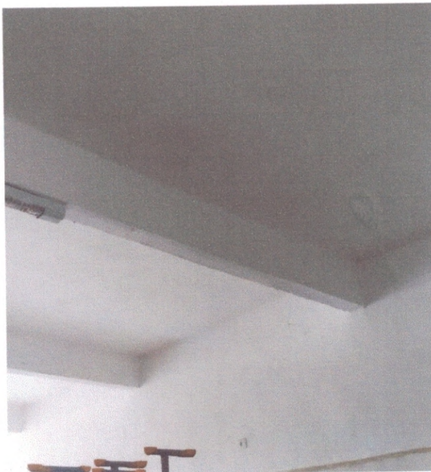
Figura 7 – Revestimentos das paredes no térreo