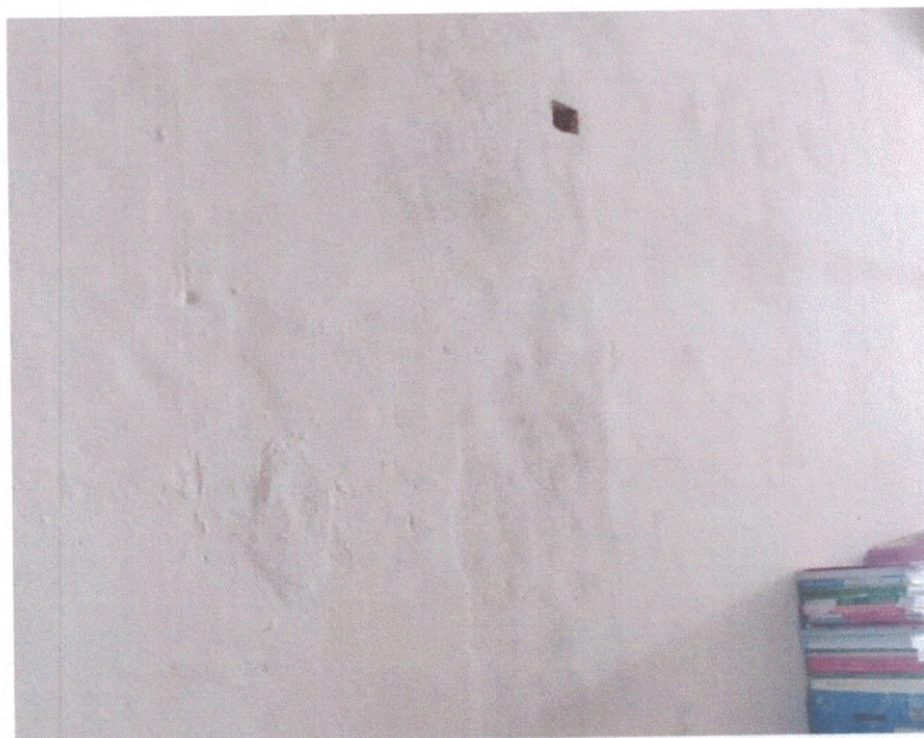
Figura 8 – Pintura com bolhas

Observou-se no pavimento superior algumas manchas de umidade nas paredes externas de encontro ao telhado colonial. Tal indício de patologia advém da umidade externa e