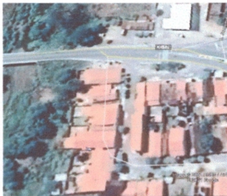
Figura 1 - Localização do Prédio de depósito de materiais