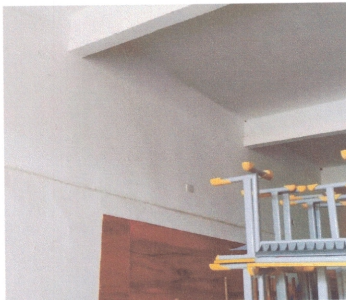
Figura 6 – Pintura da parede do térreo

A alvenaria e revestimentos das paredes apresentavam bom estado de conservação funcional. Porém observa-se que a pintura apresenta em vários pontos da edificação bolhas de ar que podem levar a desagregação futura da mesma como verificado na Figura 6 e 7. As tintas podem formar bolhas por causa da umidade sobre a cobertura. Isto pode ter ocorrido por causa da capacidade limitada de adesão, tenha sido aplicada em uma superfície esfarelada ou suja que tenha comprometido a adesão da tinta ou não tenha tido tempo suficiente para secar.