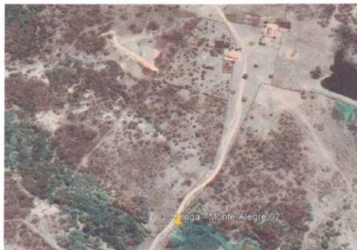
Figura 2: - Localização do trecho a ser intervindo.