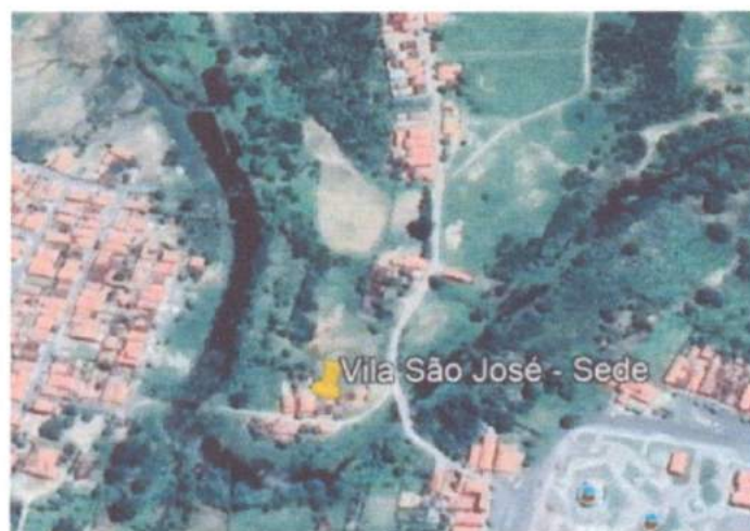
Figura 3: - Localização do trecho a ser intervindo.