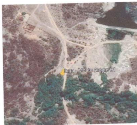
Figura 1: - Localização do trecho a ser intervindo.