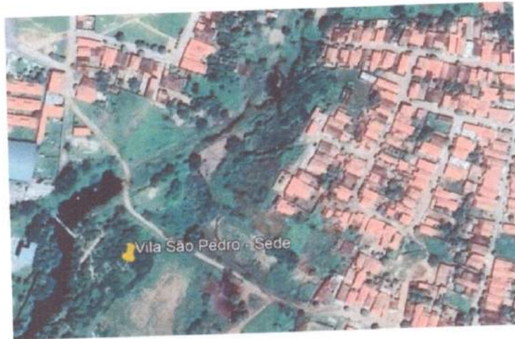
Figura 4: - Localização do trecho a ser intervindo.

DANIEL NASCIMENTO C. DOS ANJOS CREA 0220137436 PORTARIA 030/2021