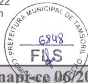
TABELA ENCARGOS SOCIAIS - LOTE 04 (sinapi-ce 06/2021)

Prefeitura Municipal de Tamboril Ceará Obra: Construção de Passagens Molhadas Local: Diversas localidades do Município de Tamboril