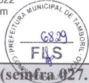
TABELA ENCARGOS SOCIAIS - LOTE 03 (sem fra 027.1)

Prefeitura Municipal de Tamboril Ceará Obra: Construção de Passagens Molhadas Local: Diversas Localidades do Município de Tamboril