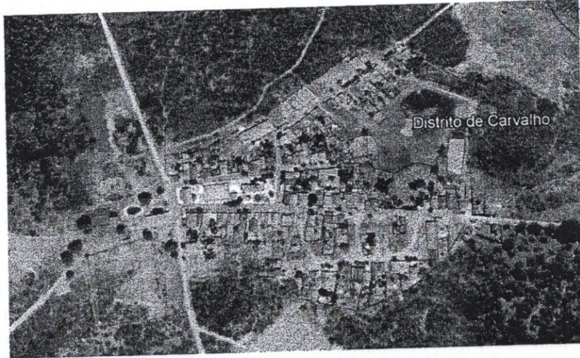
Figura 02 – Vista aérea da localidade de Carvalho.