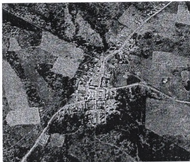
Figura 05 – Vista aérea da localidade de Grota Verde.

A localidade de Grota Verde fica no Distrito de Curatis, na zona rural do município de Tamboril, distante cerca de 35,7 km da sede. O centro da localidade está posicionado na latitude 4°52'20,00" S e longitude 40°06'58,20" O. A Figura 05 abaixo mostra uma vista aérea da mesma.