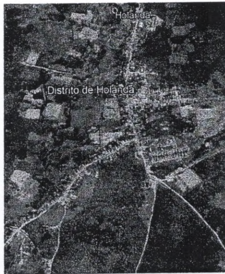
Figura 04 – Vista aérea da localidade de Holanda.

O Distrito de Holanda fica na zona rural do município de Tamboril, distante cerca de 21,0 km da sede. O centro da localidade está posicionado na latitude 4°43'11,90" S e longitude 40°22'42,80" O. A Figura 04 abaixo mostra uma vista aérea da mesma.