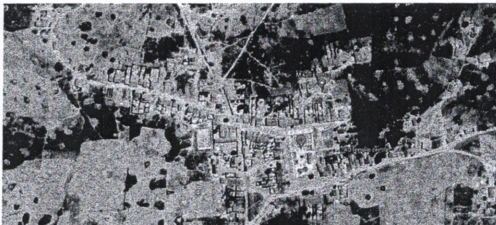
Figura 01 – Vista aérea da localidade de Açudinho.

O Distrito de Açudinho fica na zona rural do município de Tamboril, distante cerca de 21,7 km da sede. O centro da localidade está posicionado na latitude 4°50'44.8"S e longitude 40°09'24.2"W. A Figura 01 abaixo mostra uma vista aérea da mesma.