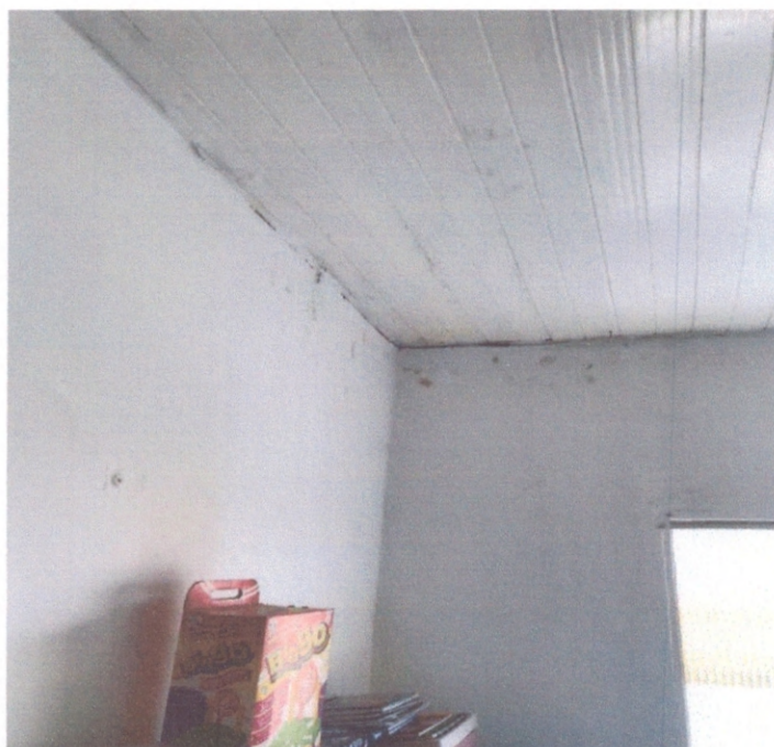
Figura 4 – Revestimento de um dos quartos

Não foram observadas trincas ou qualquer tipo de deslocamento do revestimento cerâmico, assim como nenhuma fissura ou desagregação do revestimento cimentício da parede. A alvenaria de tijolo cerâmico apresentava conformidade de construção com paredes alinhadas e com prumo adequado. As Figuras abaixo demonstram a conservação dos revestimentos.