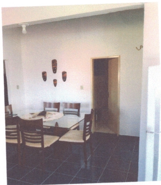
Figura 7 – Contrapiso e paredes revestidas e pintadas