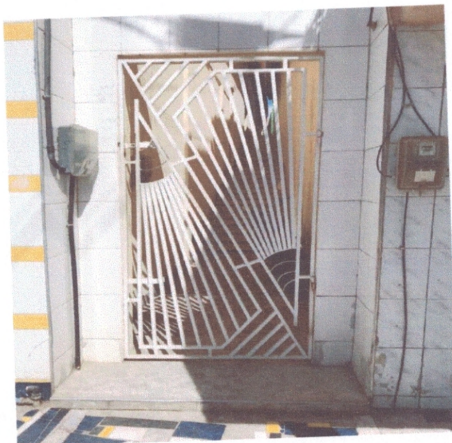
Figura 12--Portão de correr da entrada da edificação

DANIEL NASCIMENTO C. 000 40 000 CREA 020 9137436 PORTARIA 030/2021