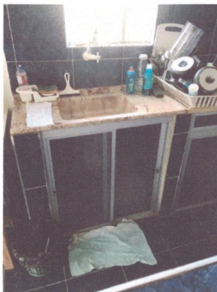
Figura 16–Pia da cozinha