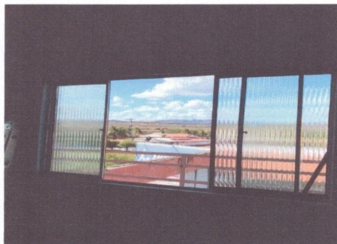
Figura 14–Janela de alumínio de um dos quartos

DANIEL NASCIMENTO C. DOS ANJOS CREA 0649137436 PORTA Nº 030/2021