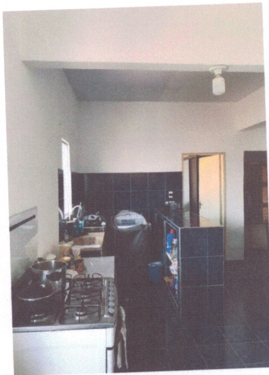
Figura 8 – Revestimento da cozinha

DANIEL NASCIMENTO C. DOS ANJOS CREA 19137436 PORTARIA 030/202