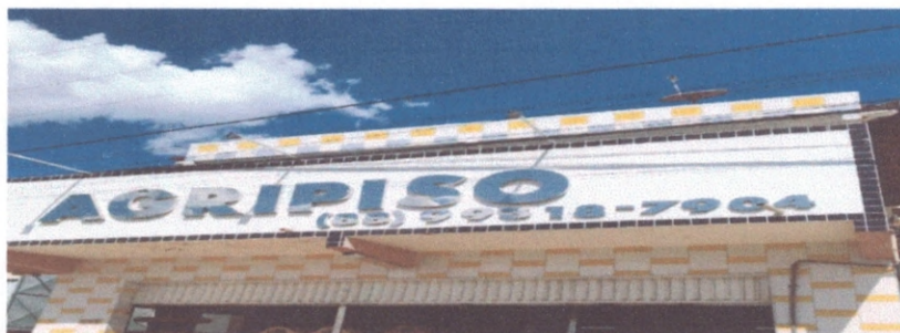
Figura 2 – Estrutura da fachada do prédio

Apesar de não terem sido encontradas patologias nas estruturas inspecionadas, é recomendado o acompanhamento dos elementos estruturais para verificação do surgimento de patologias que podem comprometer a segurança ou o estado limite de serviço do prédio como o surgimento de fissuras, trincas ou flechas em nas lajes e vigas e principalmente na marquise da fachada do prédio pois a mesma é suscetível a cargas laterais de vento e verticais móveis que podem comprometer sua estabilidade.