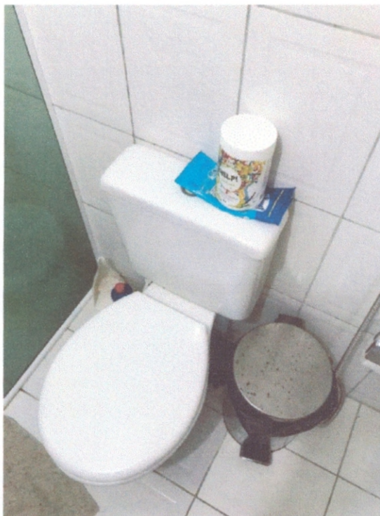
Figura 9 – Revestimento cerâmico do banheiro