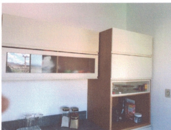
Figura 11 – Tomada e interruptor na cozinha