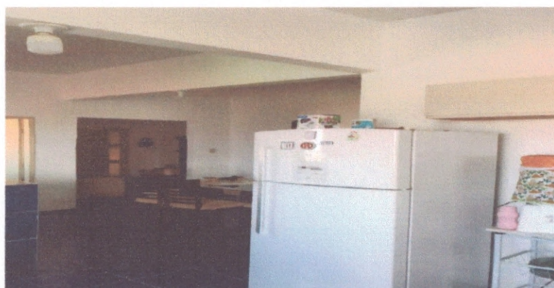
Figura 3 – Sala de entrada