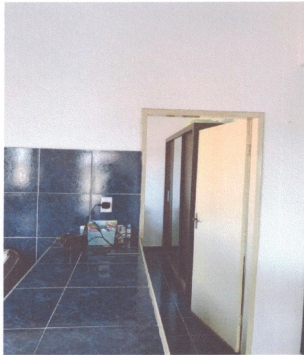
Figura 13–Porta de um dos quartos

Durante a vistoria das esquadrias foram testadas o funcionamento de cada uma, tanto da maçaneta quanto da fechadura, além do ângulo de abertura e possíveis travamentos que poderiam ocorrer. Todas as portas apresentavam bom funcionamento adequado. Além disso, as janelas do pavimento superior são de alumínio e proporcionam boa iluminação natural ao ambiente e também possuem funcionamento adequado aos usuários.