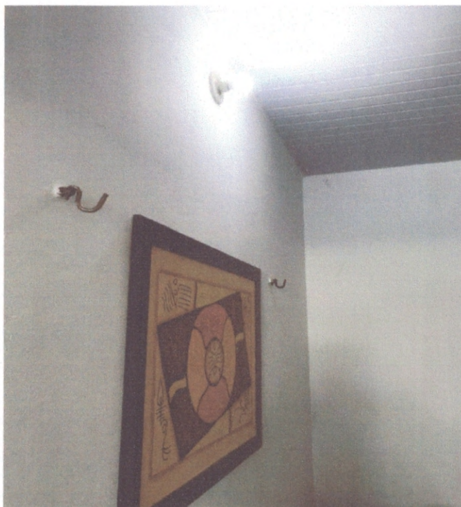
Figura 10 – Instalações elétricas de iluminação