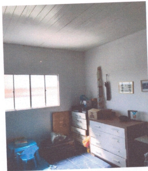
Figura 6 – revestimento de um dos quartos

DANIEL MASCIMENTO C. DOS ANJOS CPF: 067.1137436 PORTARIA 030/2021