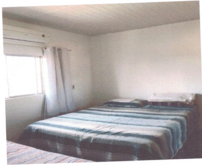
Figura 5 – revestimento do piso e das paredes da sala de entrada