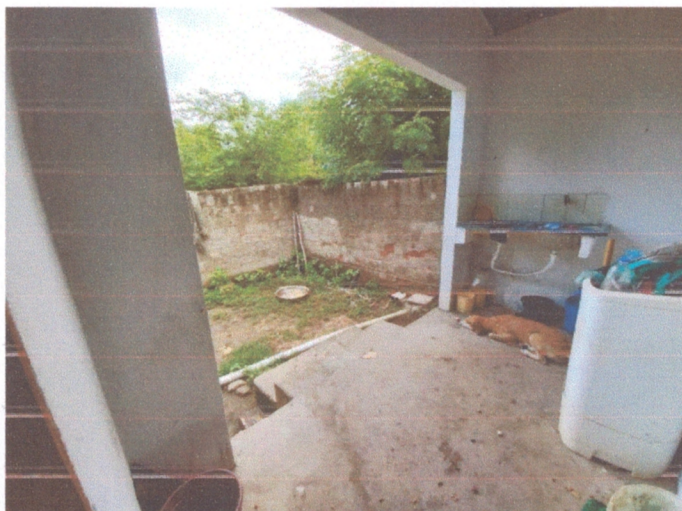
Figura 8 - Cimento