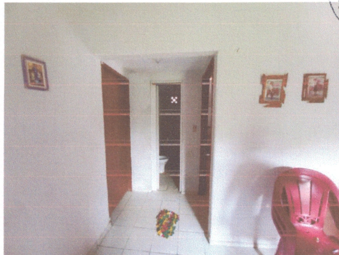
Figura 4 – Revestimento paredes