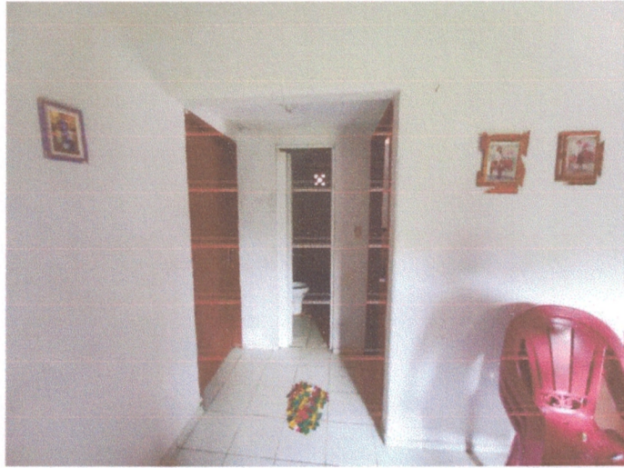
Figura 11 - Porta dormitórios