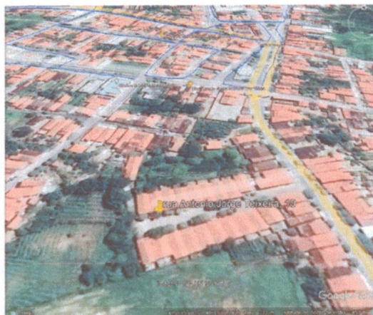
Figura 1 - Localização

A edificação objeto do presente laudo de vistoria é o prédio destinado aluguel social pela Prefeitura Municipal de Tamboril através da Secretaria do Trabalho e Assistência Social. Este imóvel está localizado na rua Antônio Jorge Teixeira, 10, Tamboril – CE, 63750-000.