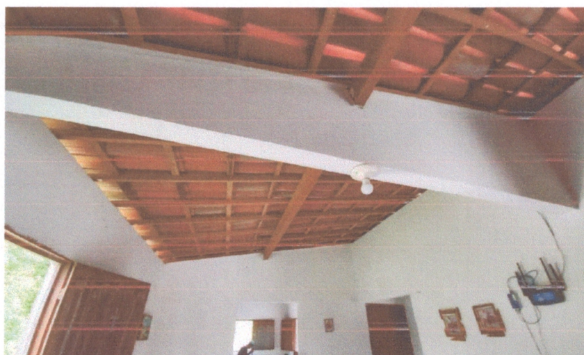
Figura 10 - Ponto de iluminação