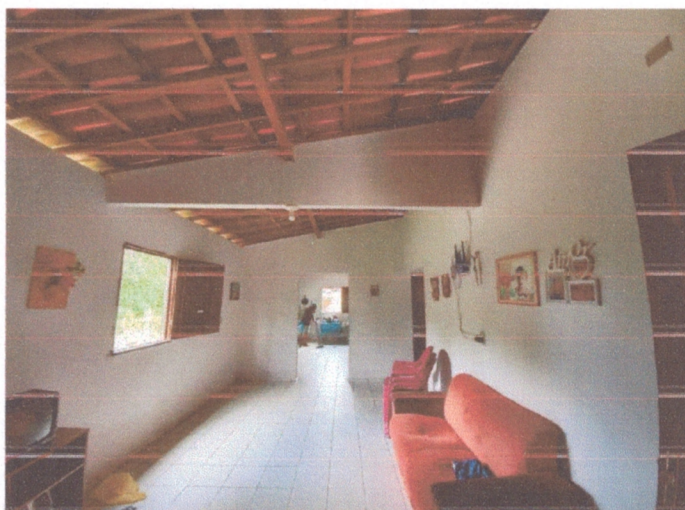
Figura 3- Caibros e ripas apoiados nas paredes