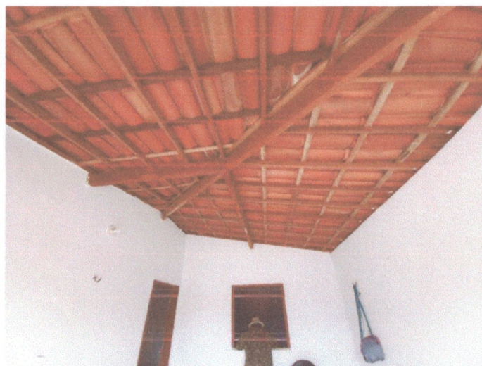
Figura 2 – Estrutura da casa