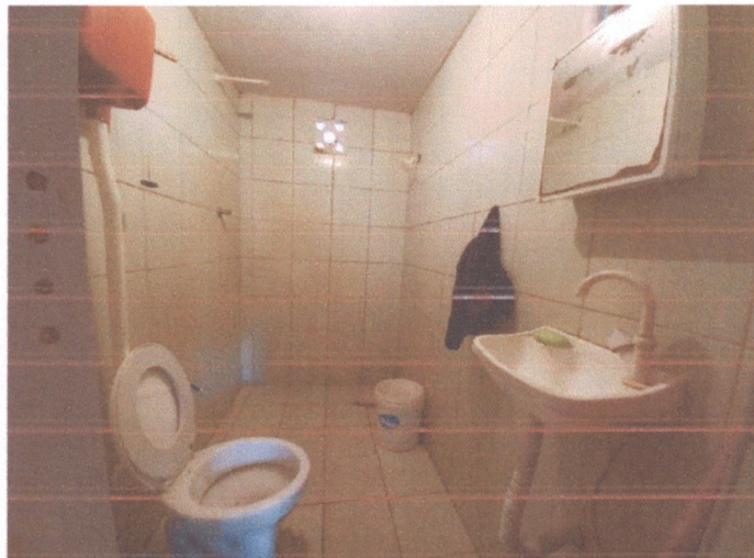
Figura 5 - Revestimento banheiro