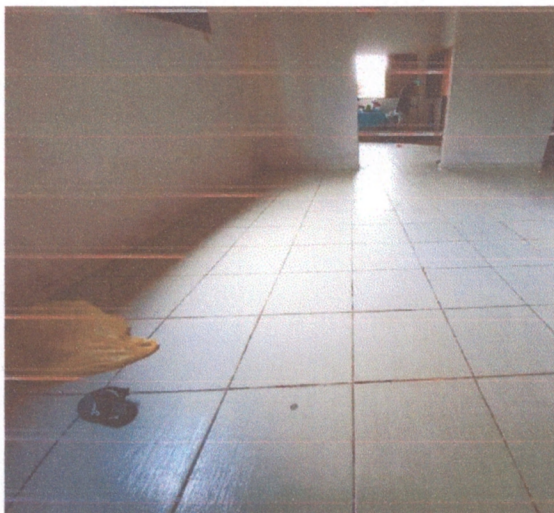
Figura 7 – piso cerâmico

O piso do prédio é constituído todo em cerâmica, apenas a parte da lavanderia é cimento.