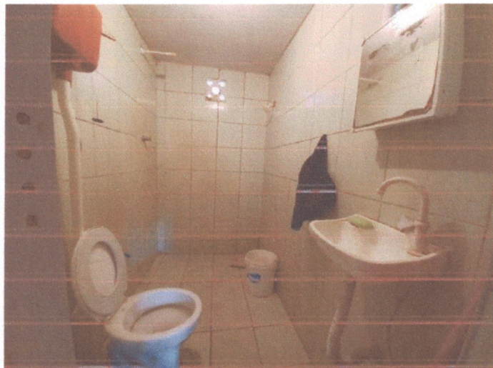
Figura 12 – Instalações hidrossanitárias banheiro

Na vistoria, observou-se que os aparelhos hidrossanitários presentes no banheiro apresentavam conformidade física e de instalação adequados as normas técnicas.