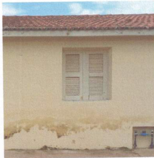
Figura 11 - Janela fachada

DANIEL MASCHEIRO C. DOS ANJOS CREA 062.9137436 PORTARIA 030/2021