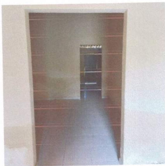
Figura 6 – Revestimento parede

A alvenaria apresenta boas condições, porém o revestimento de algumas paredes apresenta condições ruins pela umidade advinda da fundação. O revestimento das paredes do banheiro está em boas condições.