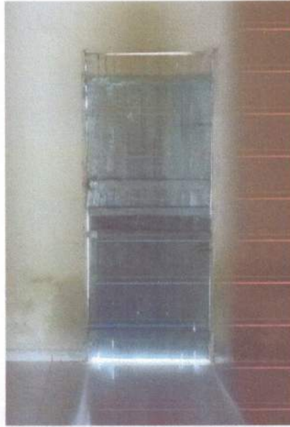
Figura 12 - Porta cozinha