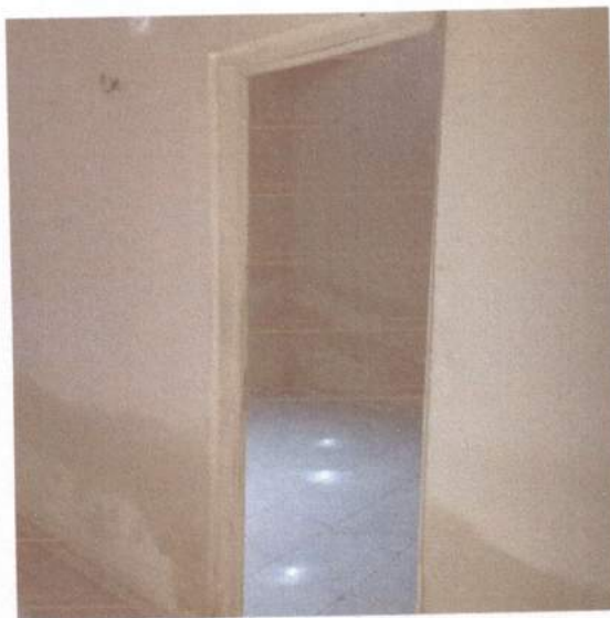
Figura 5 - Umidade parte interior da casa