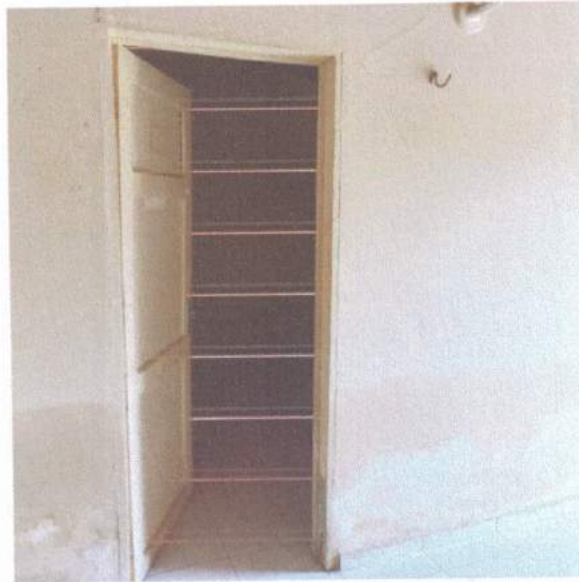
Figura 10 – Porta dormitório