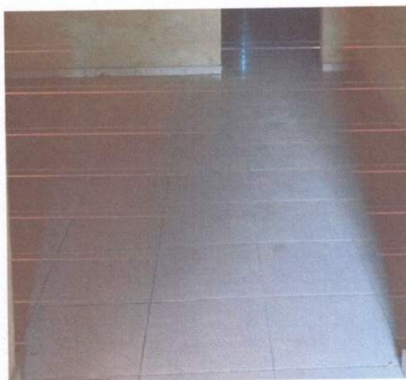
Figura 8 - Piso cerâmico

O piso do prédio é todo constituído por cerâmica e apresenta condições satisfatória de funcionalidade.