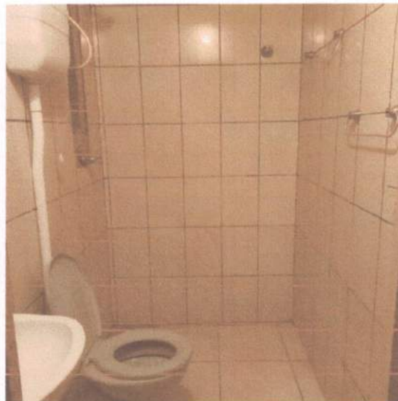
Figura 13 – Instalações banheiro

Na vistoria, observou-se que os aparelhos hidrossanitários presentes no banheiro apresentavam conformidade física e de instalações adequados as normas técnicas.