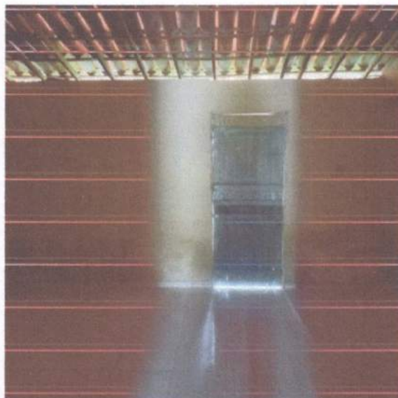
Figura 2 –Estrutura da casa

Durante a vistoria foram constatadas patologias aparentes. Umidade aparente na parte inferior das paredes em todos os locais do imóvel, assim como mostra as figuras 2, 3. O madeiramento, caibros, ripas e linhas, assim como as telhas apresentam boas condições. As vigas de madeira que sustentam o telhado apresentam-se engastadas nas paredes e, dessa forma, favorecem o surgimento de patologias associadas a carga pontual exercida em um ponto, como verificado.