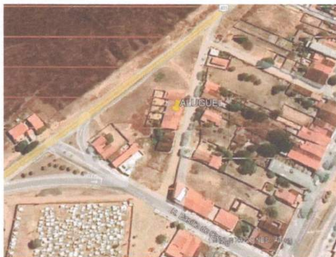
Figura 1 – Localização