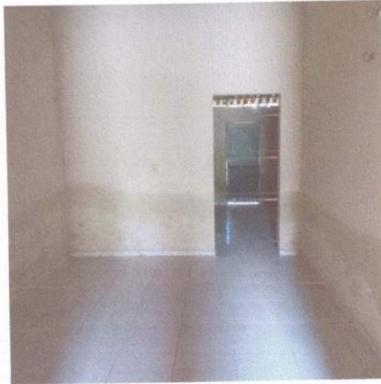
Figura 3 - Umidade aparente