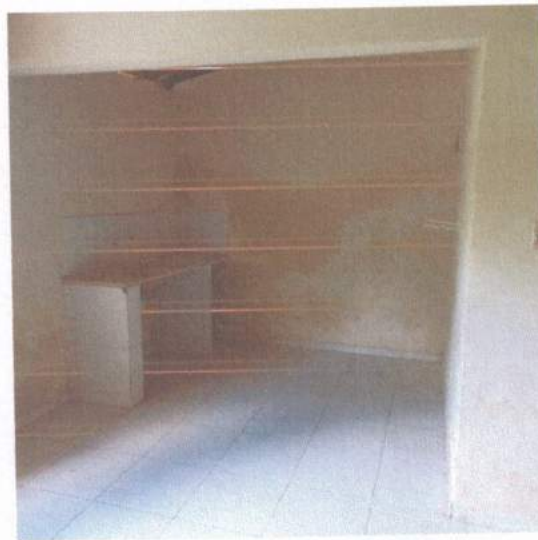
Figura 4 - Umidade parede da cozinha

DANIEL NASCIMENTO C. DOS ANJOS CREA 0619137436 PORTARIA 030/2021