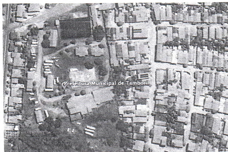
Figura 1: - Vista aérea do local.